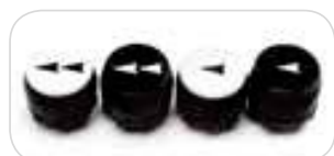
PVCHBD - PVCHSD - PVTHBD - PVTHSD